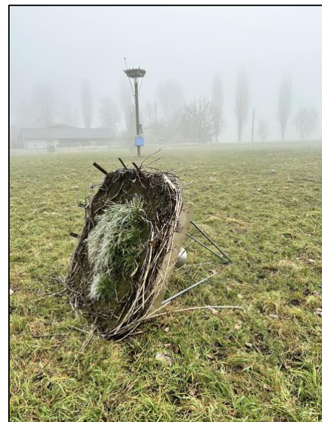
Acht Jahre haben ihnen zugesetzt.