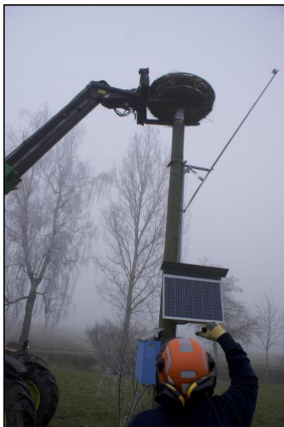
Beim Kamera-Nest musste der Storch für kurze Zeit ausziehen.