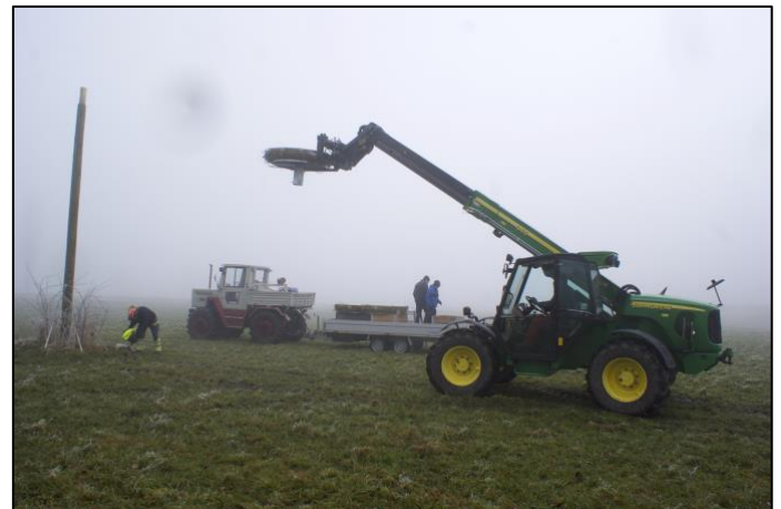
Und das neue auf die Stange gesetzt.