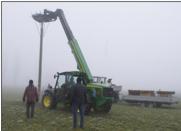
Das erste Nest wird heruntergehoben.